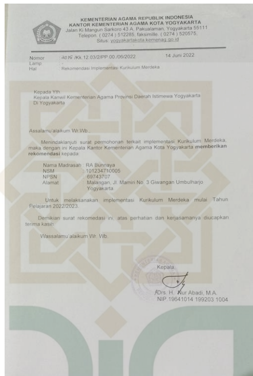
Gambar 1.1 surat keterangan kurikulum merdeka

Berdasarkan penelitian sebelumnya Wardah dan Anggi. Menjelaskan bahwa Perkembangan kognitif anak di RA Az-Zahra Natar mengalami kemajuan yang nyata seiring berjalannya waktu, dikarenakan pendekatan pembelajarannya yang tidak monoton. Penggunaan metode bermain peran diimplementasikan untuk memerankan karakter-karakter atau objek-objek di sekitar anak, bertujuan agar anak dapat merangsang daya imajinasi mereka dan lebih mendalam dalam memahami serta merasakan kegiatan yang sedang berlangsung melalui permainan peran tersebut. Dengan penelitian