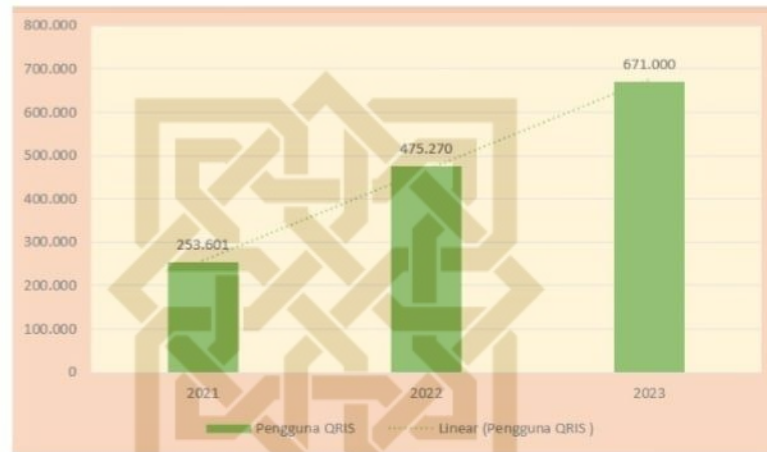
Gambar 1. 3 Pengguna QRIS di Daerah Istimewa Yogyakarta

sebesar 613.000 merchant yang sudah mengimplementasikan QRIS dalam kegiatan transaksi pembayaran.