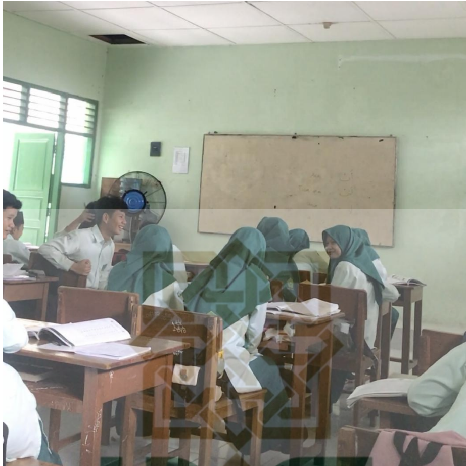
Foto kegiatan pembelajaran dengan metode pembelajaran SAVI