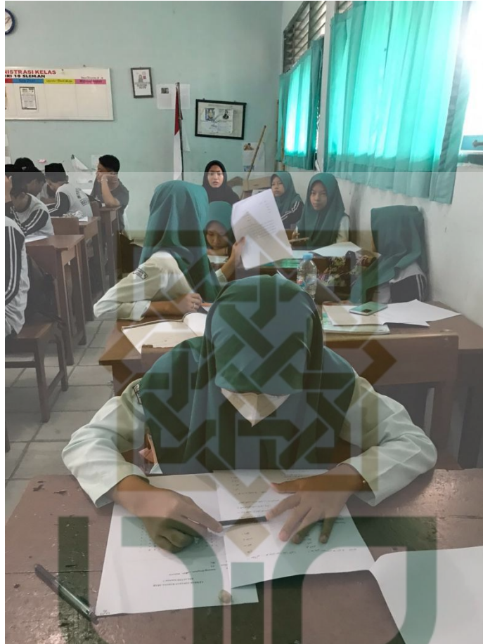
Foto Kegiatan Pembelajaran dengan metode konvensional