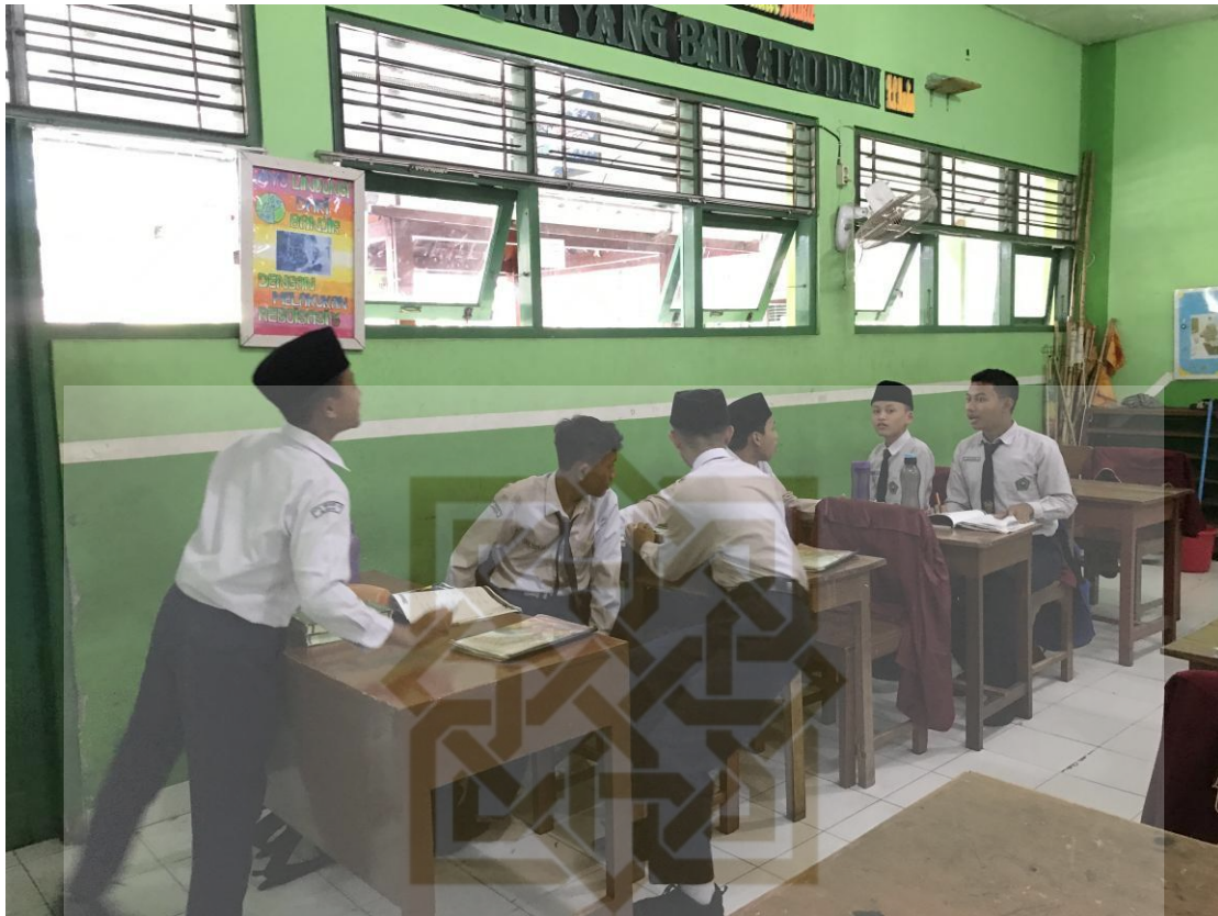
Foto pemberian posttest

Pemberian game dengan menggunakan metode pembelajaran SAVI