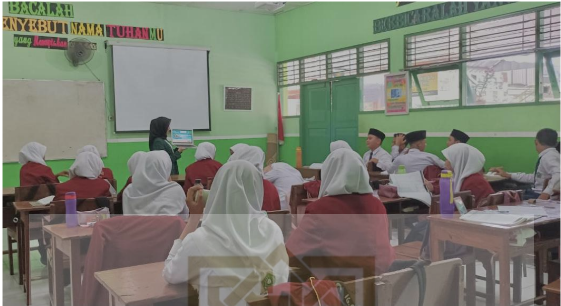
Foto kegiatan diskusi pembelajaran bahasa Arab dengan metode SAVI