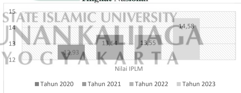
Gambar 1. 1 Indeks Pembangunan Literasi Masyarakat 2020-2023 Tingkat Nasional

Selain dari data di atas, Perpustakaan RI juga melakukan survei yaitu, Indeks Pembangunan Literasi Masyarakat (IPLM) yang menunjukkan bahwa terdapat peningkatan jika dibandingkan dengan tahun-tahun sebelumnya. Tendensi perkembangan IPLM dari kurun waktu tahun 2020 sampai tahun 2023 menunjukkan kenaikan. Indikator yang menjadi acuan adalah pemerataan layanan perpustakaan, pemerataan koleksi perpustakaan, pemerataan tenaga perpustakaan, tingkat kunjungan pemustaka, perpustakaan ber-SNP, keterlibatan masyarakat dalam sosialisasi perpustakaan, dan jumlah pemustaka.