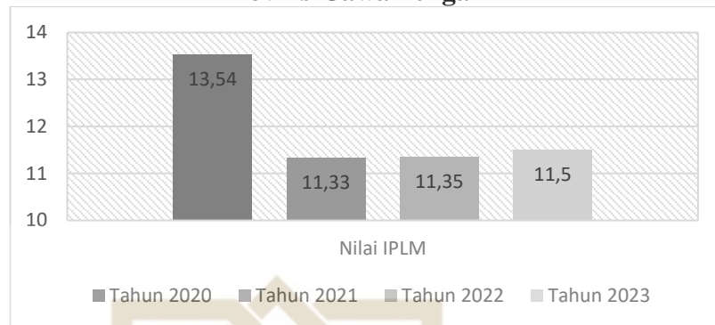
Gambar 1. 2 Indeks Pembangunan Literasi Masyarakat 2020-2023 Provinsi Jawa Tengah

Mengerucut pada data IPLM kabupaten, Kabupaten Kendal hanya mencapai angka 47,87 masuk ke dalam kategori rendah di tahun 2022. Pada tahun 2023 IPLM Kabupaten Kendal mencapai nilai 55,72 masuk ke dalam kategori sedang. 10 Dibandingkan dengan perolehan nilai IPLM tahun 2022 di sekitar Kabupaten Kendal yakni Kab/Kota Semarang dengan nilai 77,88; Kab/Kota Batang dengan nilai 78,15; dan Kab/Kota Temanggung dengan nilai 60,23. 11 Merujuk pada data tersebut Kabupaten Kendal mendapat nilai IPLM terendah di antara kabupaten/kota sekitarnya.