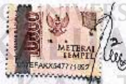
Asmayanti NIM : 16110019