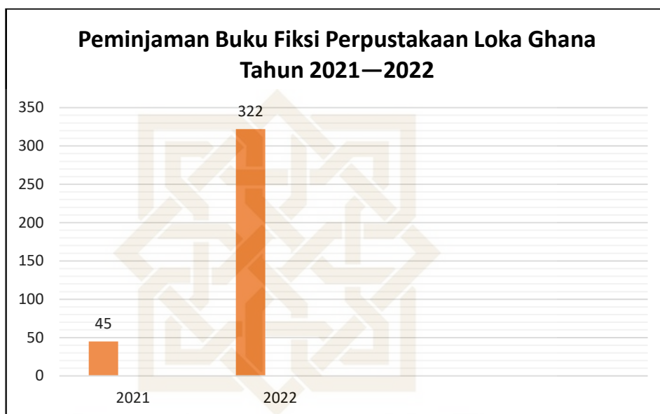
Gambar 2 Peminjaman buku fiksi tahun 2021-2022

yaitu tahun 2022, saat siswa sudah melakukan pembelajaran luring, jumlah peminjam buku fiksi melonjak drastis menjadi 322 peminjaman.