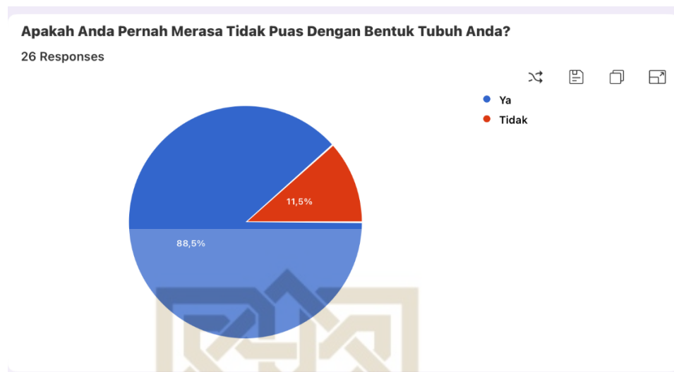
Bagan 1: Diagram Studi Pendahuluan Ketidakpuasan Bentuk Tubuh

Sari dan Suarya (2018) mengemukakan bahwa ketidakpuasan terhadap bentuk tubuh dapat menyebabkan seseorang terlalu memperhatikan kekurangan fisiknya, menilai tubuhnya dengan cara yang negatif, serta mengurangi rasa percaya diri. La Grace dan Lopez (1998) menyatakan bahwa penilaian negatif terhadap bentuk tubuh dapat menghambat kemampuan individu untuk berinteraksi secara sosial. Hal ini disebabkan munculnya kecemasan sosial dan ketakutan terhadap evaluasi negatif orang lain, yang mendorong inidividu menghindari aktivitas sosial. Hal ini juga merujuk pada data yang diperoleh dari laman Timesindonesia.co.id (Khusnul Hasana, 2020) yakni, wanita pada masa awal dewasa sering mengalami ketidakpuasan bentuk tubuh terutama karena media sering menampilkan standar kecantikan yang dianggap sebagai tubuh ideal. Dalam hal ini mahasiswi alumni pondok pesantren termasuk pada kategori usia perkembangan dewasa awal.