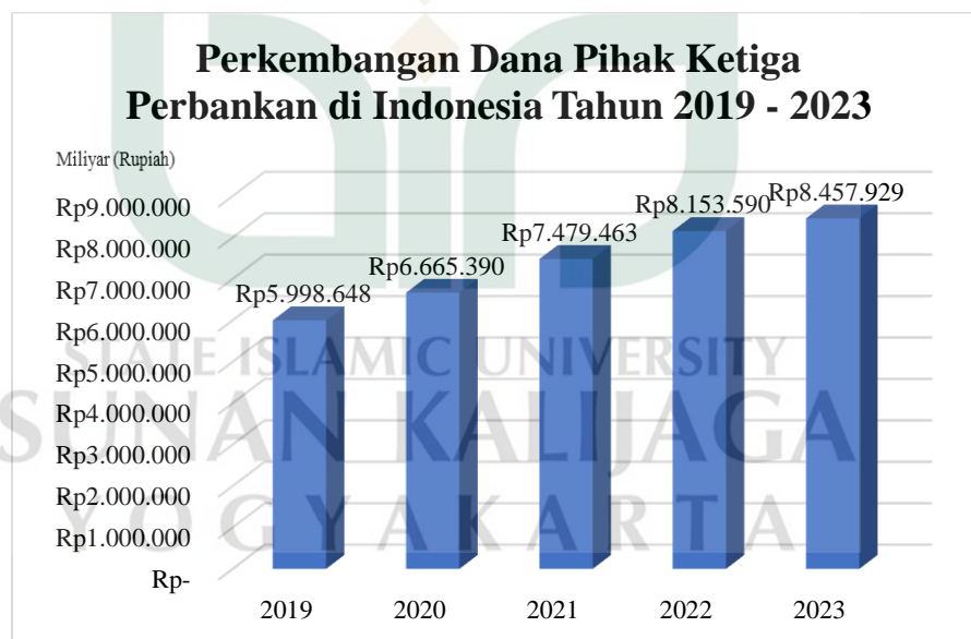
Gambar 1.1 Grafik Perkembangan DPK di Indonesia Tahun 2019 - 2023

spekulasi yakni keputusan bank untuk memegang likuiditasnya dengan menginvestasikannya dalam bentuk aset keuangan dengan tujuan untuk mencari keuntungan (Keynes, 1936). Penelitian ini menggunakan teori preferensi likuiditas karena berkaitan dengan variabel dalam penelitian ini yang secara implisit mendorong bank untuk memegang dan mengelola likuiditas dari ketiga motif dalam preferensi likuiditas. Dana Pihak Ketiga (DPK) dan size of bank secara langsung memengaruhi kebutuhan transaksi dan berjaga-jaga bank, sedangkan inflasi lebih erat kaitannya dengan motif spekulasi karena ekspektasi terhadap suku bunga yang disebabkan oleh naik atau turunnya inflasi yang membuat bank akan menahan dana.