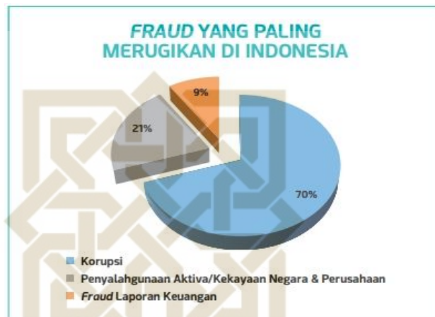
Gambar 1. 1 Fraud yang paling merugikan di Indonesia

2009). Akibatnya, dana nasabah diselewengkan sebesar Rp1,45 triliun. Kasus tersebut menunjukkan betapa rentan khususnya sektor keuangan terhadap praktik kecurangan, meskipun telah ada regulasi dan pengawasan yang ketat.