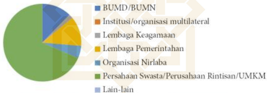
Gambar 1. 1 Diagram Data Lulusan Mahasiswa

Berdasarkan data yang diperoleh dari Kalijaga Tracer Study sebanyak 57 alumni Perbankan Syariah UIN Sunan Kalijaga Angkatan 2022/2023 adalah sebagai berikut: