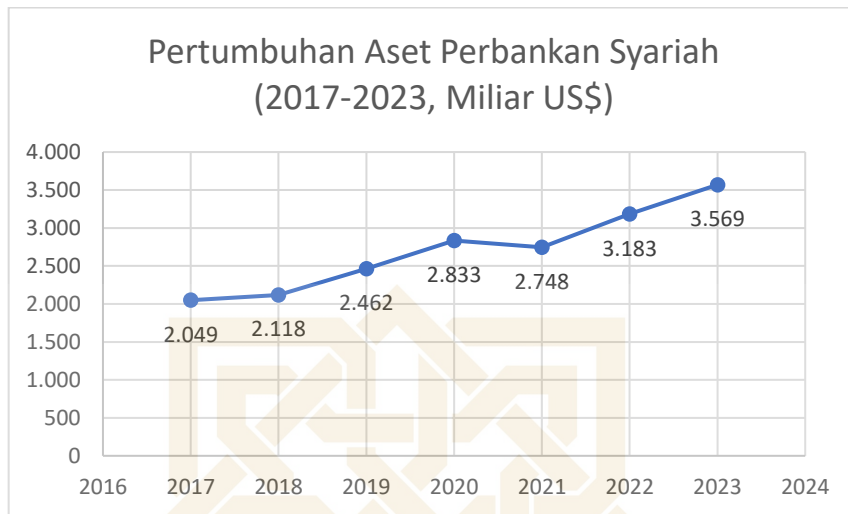
Gambar I. 1. Pertumbuhan Aset Perbankan Syariah