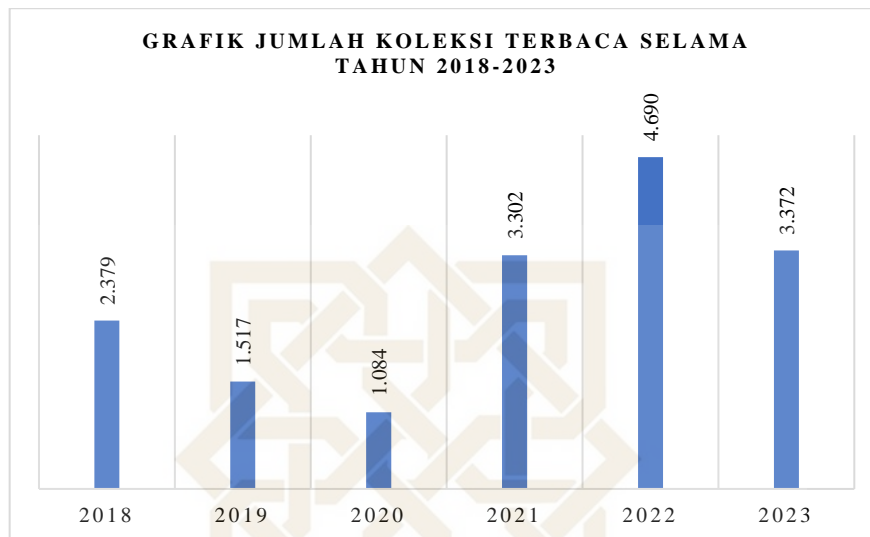
Grafik 2 Jumlah Koleksi Terbaca Selama Tahun 2018-2023

Sumber: Olah Data Perpustakaan Gunungkidul, 2024