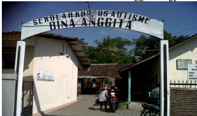
Gambar 3. Sekolah Khusus Autisme Bina Anggita Yogyakarta