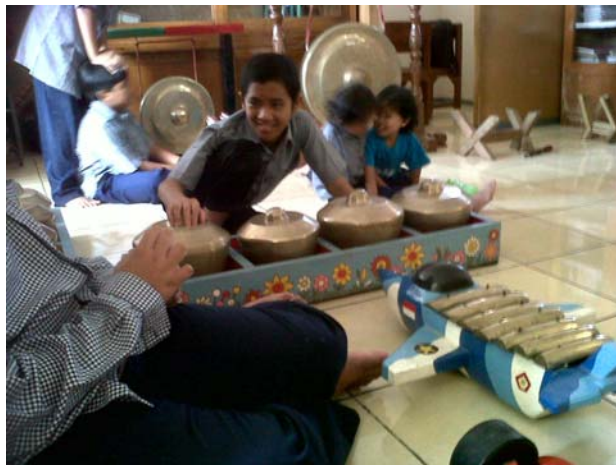
Gambar 5. Keadaan sebelum terapi karawitan sekar gending dimulai