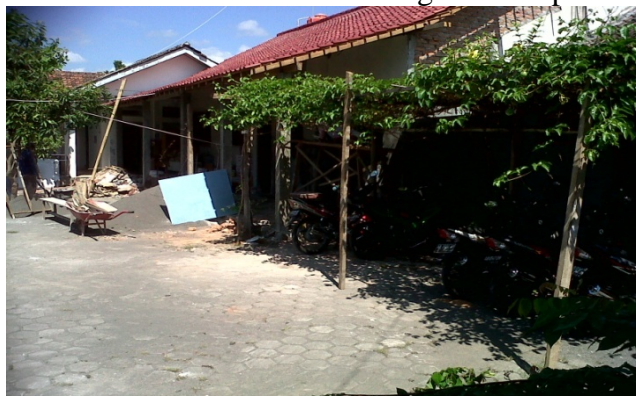
Gambar 2. Gedung Khusus semi formal dalam bentuk kegiatan terapi musik (karawitan)