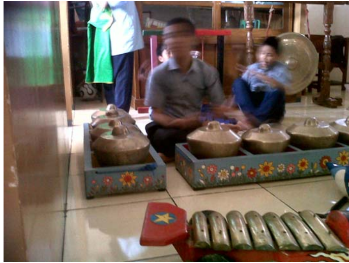
Gambar 6. Sesi terapi karawitan gendhing