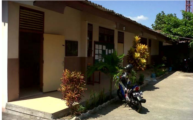
Gambar 1. Gedung Perkantoran