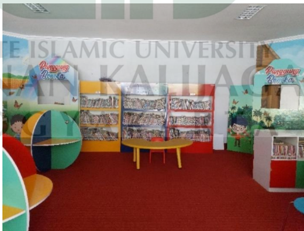
Gambar 1: Ruang Kreasi Anak

Lebih lanjut Kota Surakarta pada tahun 2019 mendapat predikat Kota Layak Anak (KLA) Utama yang sebelumnya juga di tahun 2017 dan 2018 mendapatkan predikat yang sama (Prov Jateng, 2019, hlm. 1). Istilah tersebut diperkenalkan pertama kali oleh Kementerian Pemberdayaan Perempuan dan Perlindungan Anak RI pada tahun 2005 melalui kebijakan Kabupaten/Kota Layak Anak. Salah satu indikator Kota Layak Anak (KLA) adalah menyediakan fasilitas informasi layak anak yang dapat diakses oleh semua anak dan jumlahnya meningkat setiap tahun, hal ini berkaitan dengan perpustakaan. Dengan menyandang predikat sebagai Kota Layak Anak (KLA) Utama di tahun 2019, Kota Surakarta didukung oleh berbagai pihak untuk mendapatkan predikat tersebut salah satunya perpustakaan yang memiliki layanan anak yang dapat mendukung penyediaan fasilitas informasi layak anak.