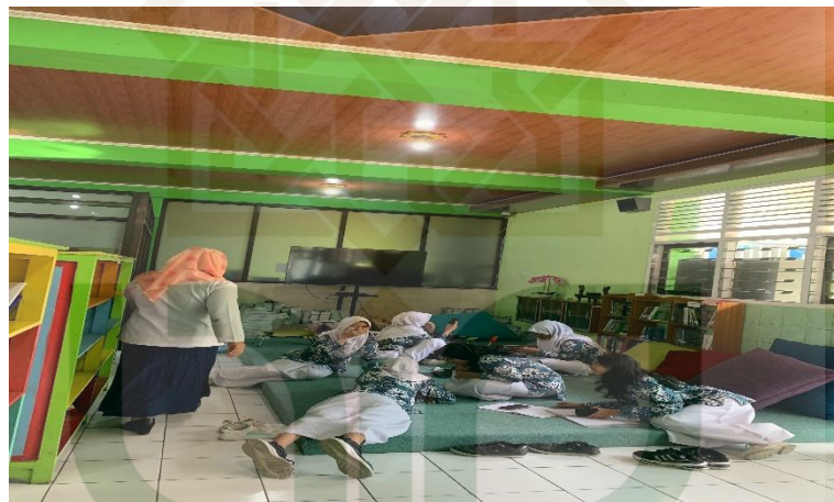
Gambar 1. 2 Dokumentasi ruang perpustakaan

Menurut data kunjungan yang dimiliki Perpustakaan SMA Negeri 1 Sleman pada tahun 2021, 2022, dan 2023 yang peneliti peroleh, menunjukkan bahwa setiap tahunnya jumlah kunjungan di Perpustakaan SMA Negeri 1 Sleman mengalami peningkatan yang cukup tinggi. Peningkatan ini merupakan pencapaian yang baik bagi Perpustakaan SMA Negeri 1 Sleman.