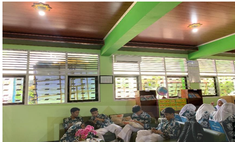
Gambar 1. 1 Dokumentasi ruang perpustakaan