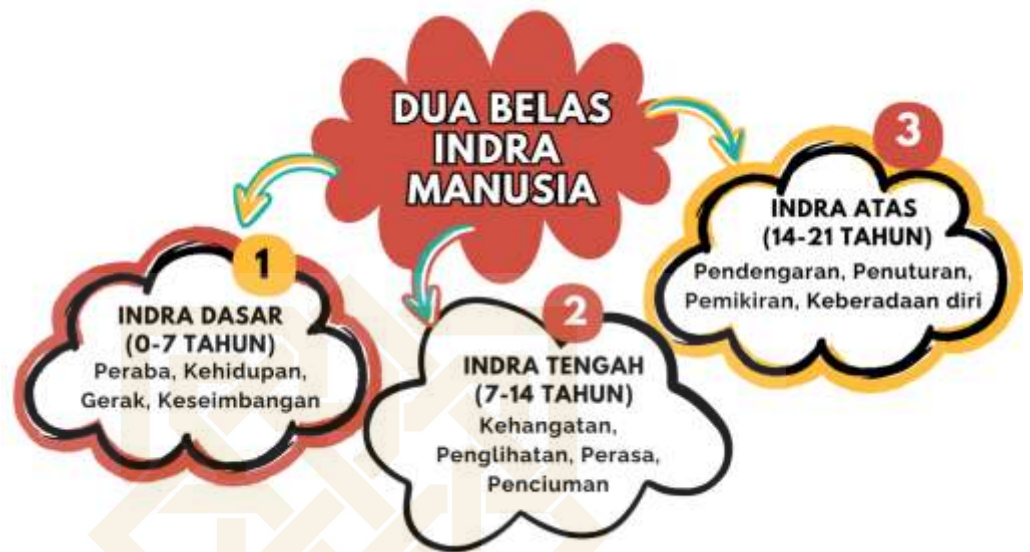
Bagan 1. Indera Dasar Anak Usia Dini

Pendekatan pendidikan yang dikemukakan Steiner bersifat holistik “ Waldorf education is about respecting the value of the human being... learning in a three-tiered way: interactively, intellectually, and emotionally ” 70 . Pendidikan Waldorf memberikan pendidikan secara menyeluruh, tidak hanya berfokus pada kemampuan kognitif tetapi mencakup pengetahuan yang diterima melalui tangan ( hands ), hati ( heart ), dan kepala ( head ). Segala sesuatu yang dikerjakan oleh tangan akan membangun kehendak yang kuat dari dalam diri individu yang mendorong untuk mengerjakan sesuatu yang disebut willing . Informasi yang masuk dan meresap ke hati dari proses yang diperoleh dari tangan akan dirasakan anak sebagai sesuatu yang menyenangkan ( feeling ). Informasi yang masuk ke kepala dari hasil indera dan perasaan senang akan menstimulasi proses