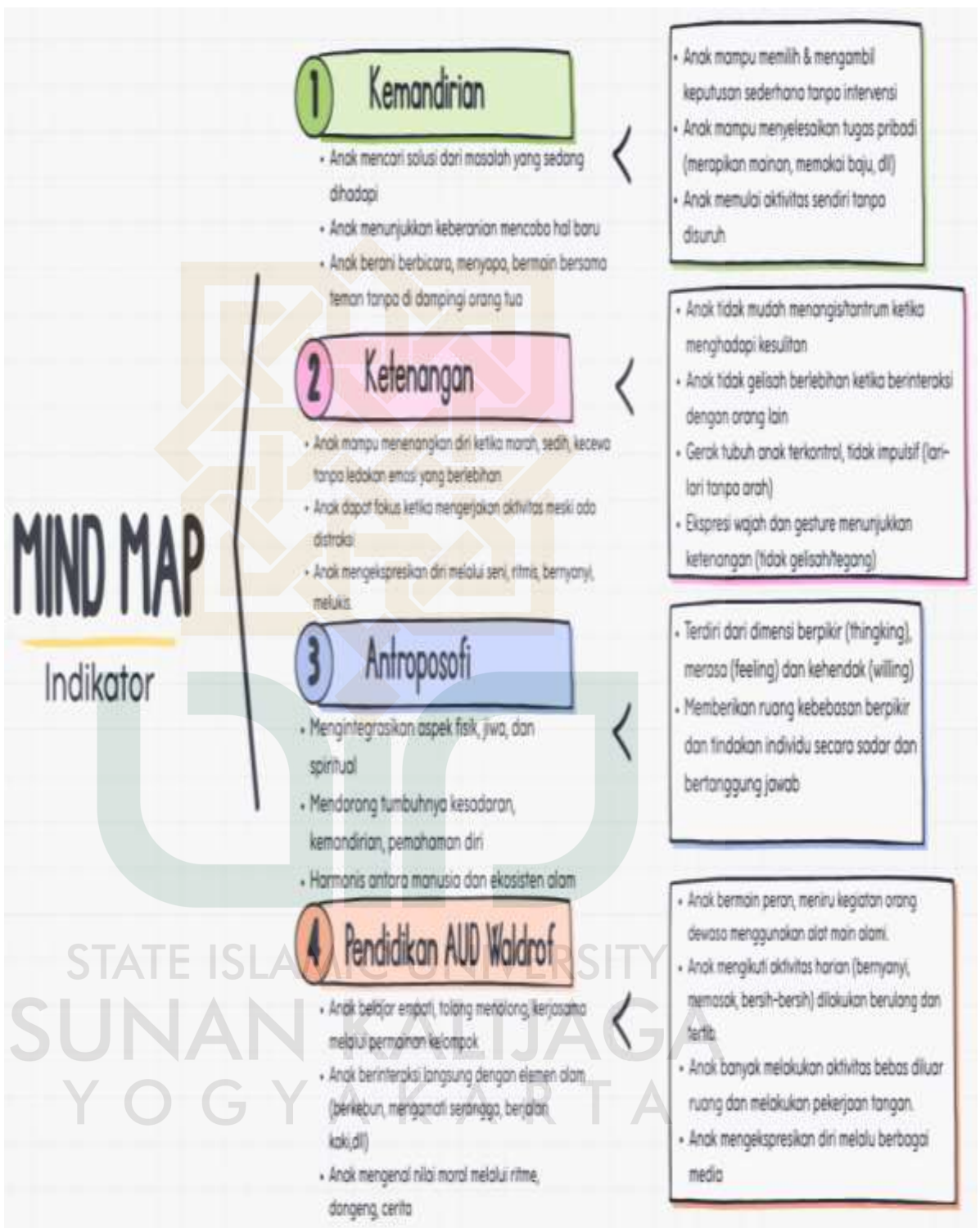
Bagan 2 Indikator Kemandirian Ketenangan