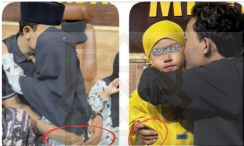
Gambar 3. Cuplikan Gus yang Viral

tanggung jawab moral yang sangat berat sebagai seorang pendakwah, (Detik.com, 2024a).