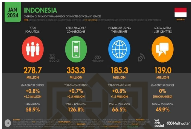
Gambar 1. Data Pengguna Internet di Indonesia per 2024