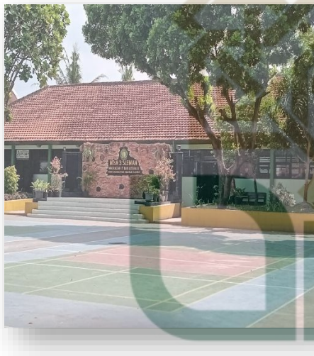
Gambar 9. Dokumentasi Lingkungan MTsN 3 Sleman.