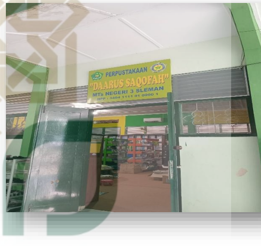
Gambar 10. Dokumentasi Perpustakaan MTsN 3 Sleman.