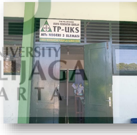
Gambar 14. UKS