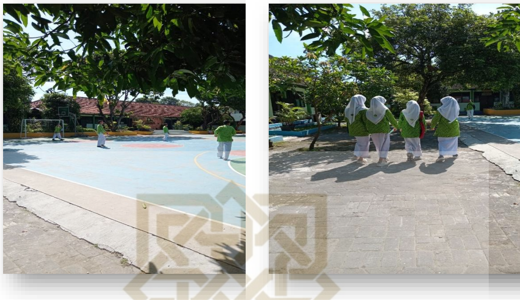
Gambar 15 & 16. Suasana dan Kegiatan Siswa MTs N 3 Sleman.