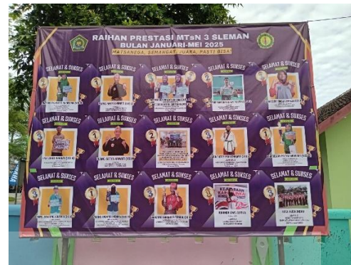
Gambar 8. Poster Prestasi MTsN 3 Sleman