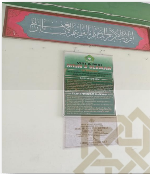
Gambar 11. Visi &amp; Misi MTs N 3 Sleman