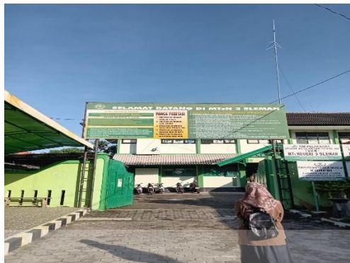
Gambar 7. Observasi