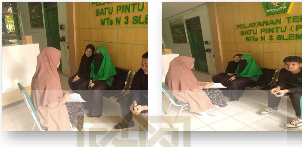
Gambar 5. Wawancara bersama Siswa-siswi MTs N 3 Sleman