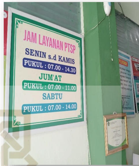
Gambar 12. Jam Layanan di MTs N 3 Sleman