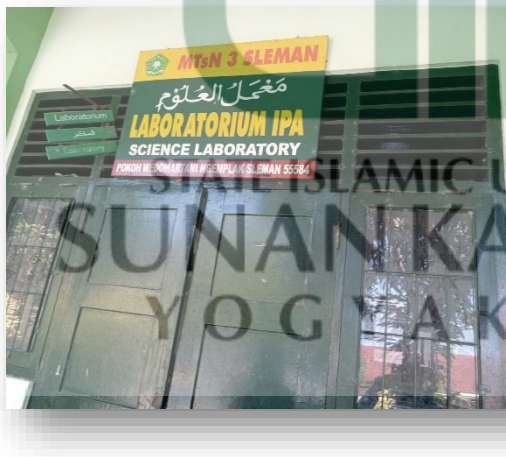
Gambar 13. Laboratorium IPA