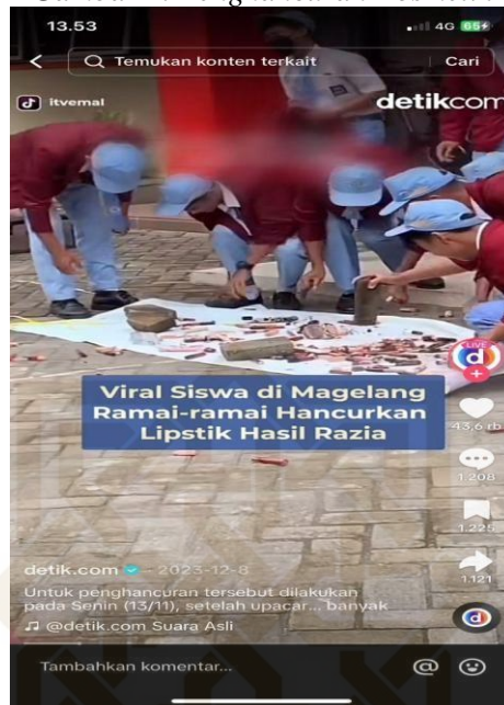
Gambar 2. Penghancuran Kosmetik