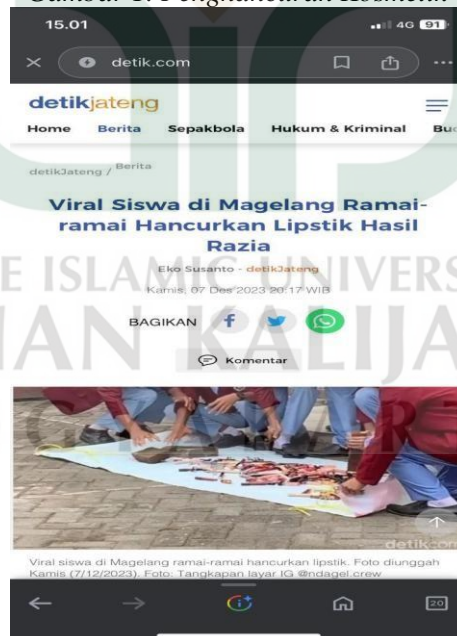
Gambar 1. Penghancuran Kosmetik

Viral di media sosial video penyitaan kosmetik di kalangan anak sekolah yang diunggah oleh akun @detik.com menyebutkan bahwa aksi penyitaan kosmetik dilakukan oleh guru. Penyitaan kosmetik terjadi karena siswi melanggar tata tertib yang berlaku di sekolah. Banyak siswi yang pro dan kontra dengan kejadian penyitaan kosmetik. Bahkan siswi menangis histeris ketika barangnya dirusak secara langsung. Fenomena tersebut terlihat pada beberapa sekolah SMA/SMK di Magelang.