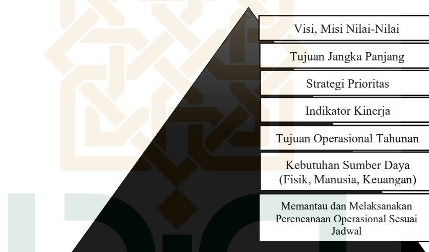
Gambar 1 Piramida Perencanaan Strategi