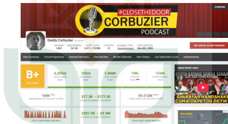
Gambar 2. Informasi tentang Kanal Youtube Deddy Corbuzier

tidak terlepas dari konsistensi Deddy Corbuzier dalam menghadirkan konten yang relevan, aktual, serta menghadirkan narasumber dari berbagai latar belakang dan bidang, termasuk politik, psikologi, hukum, sosial, budaya, hingga hiburan. Kehadiran Program Series LOGIN Season 3 di kanal ini menjadi strategi distribusi konten yang sangat efektif karena mampu menjangkau khalayak yang luas serta memberikan ruang diskusi yang mendalam terkait isu-isu sosial yang sedang berkembang di tengah masyarakat.