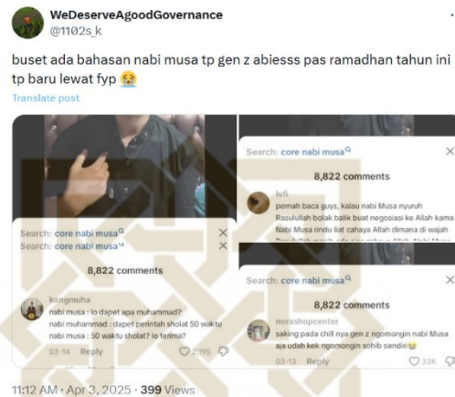
Gambar 1. 2 @1102_k membahas Nabi Musa dikaitkan dengan Gen z

lebih hidup diantara mereka. Fenomena tersebut juga didukung dengan hadirnya beberapa artikel yang mengaitkan Nabi Musa dengan Gen Z. 16