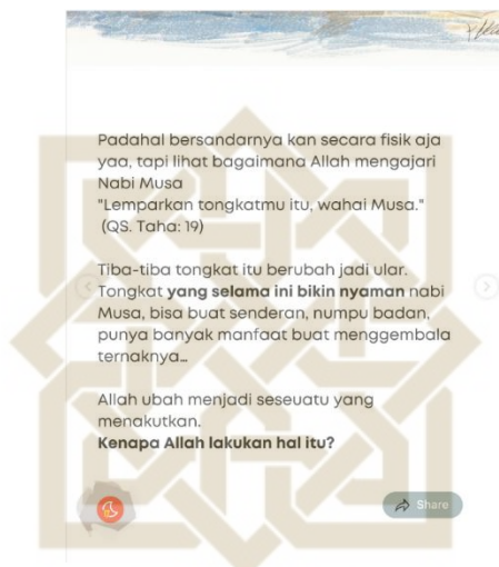
Gambar 1. 1 @Quranreview 'Zona Nyaman dan Nabi Musa'.

jauh dari mediasi. Ketergantungan masyarakat terhadap media membuatnya sulit dipisahkan, sehingga banyak narasi keagamaan yang termediatisasi dan berdampak pada kondisi sosio-kultural masyarakat Indonesia yang cenderung religius. 10