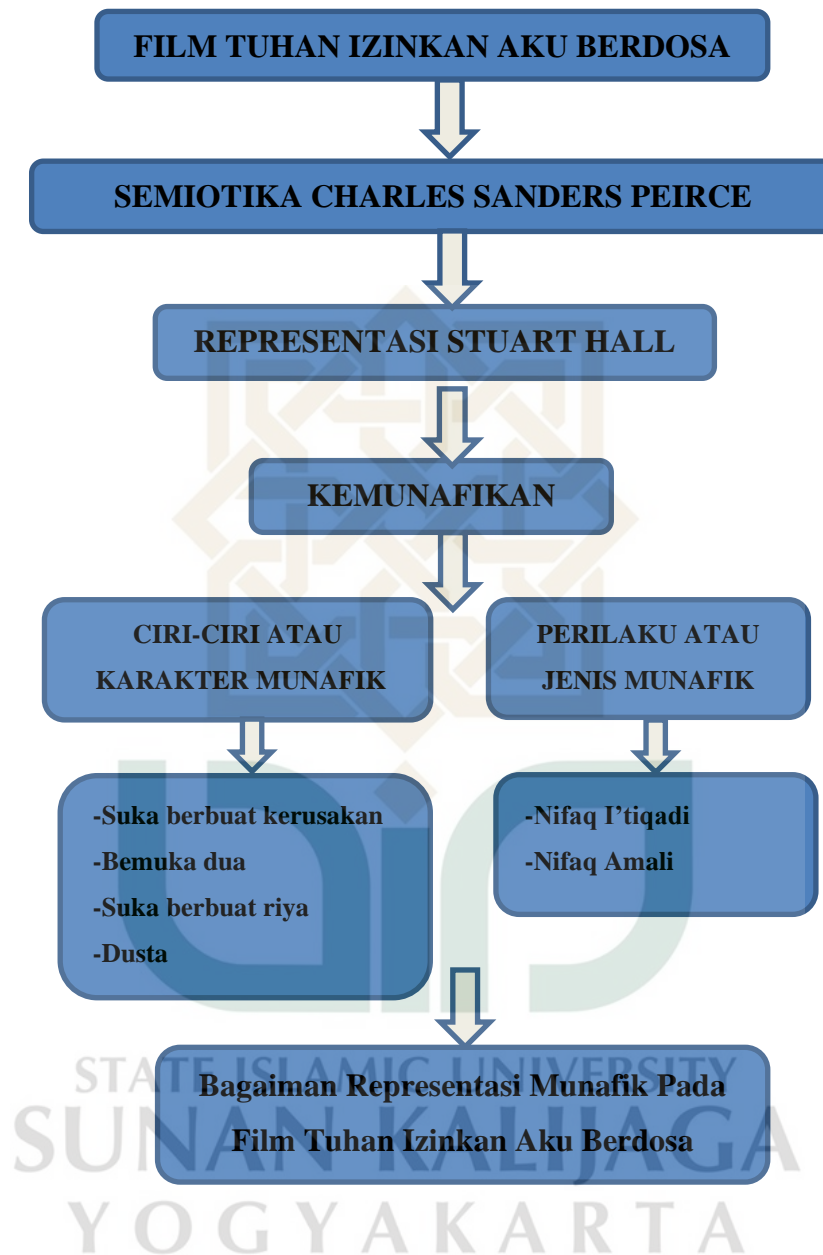
Tabel 1.1 Kerangka Berpikir