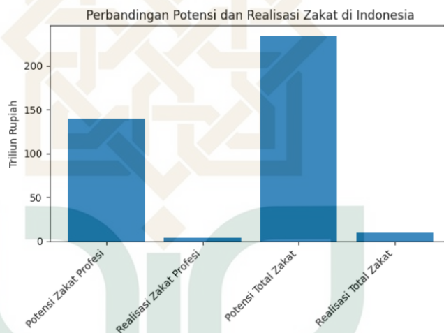
Gambar 1. 2 Perbandingan potensi dan realisasi zakat di Indonesia

Seiring dengan angka umat Muslim yang terus meningkat, harusnya zakat profesi semakin terdepan dan relevan dengan kehidupan sekarang. Namun, fakta menunjukkan bahwa tingkat kepatuhan untuk menunaikan zakat profesi masih berbanding terbalik dengan tingginya angka potensi zakat (I. S. , Beik & Arsyianti, 2016). Dua perbandingan ini menjelaskan bahwa banyak sekali persoalan sikap yang masih belum bisa dijelaskan oleh faktor ekonomi.