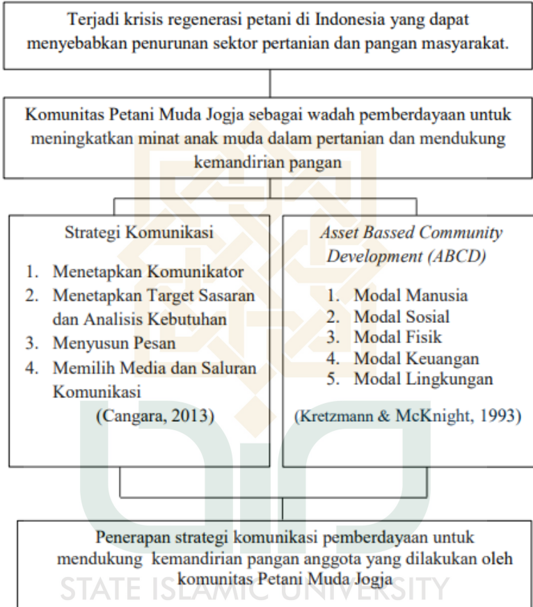
Gambar 2. Kerangka Pemikiran