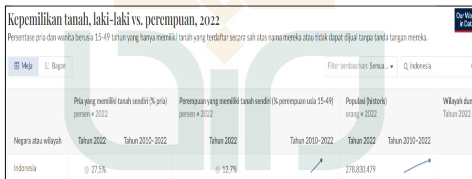
Gambar 1. Data Kepemilikan Aset Tanah Laki-laki vs Perempuan

terhadap sumber daya ekonomi. Meski menjadi aktor utama penggerak ekonomi rakyat, perempuan pelaku usaha menghadapi hambatan struktural yang sistemis khususnya dalam hal akses permodalan. 3 Data BPS 2023 menunjukkan lebih dari 60% atau 37 juta dari total UMKM dijalankan oleh perempuan, namun mereka justru mengalami kesulitan memenuhi persyaratan pembiayaan perbankan. 4 Data World Bank 2022 memperlihatkan kepemilikan aset tanah perempuan Indonesia lebih rendah dibanding laki-laki, menciptakan hambatan struktural untuk memperoleh pembiayaan. 5 Kondisi ini menciptakan lingkaran setan di mana ketiadaan agunan menghalangi akses pembiayaan, sementara tanpa pembiayaan mustahil bagi perempuan untuk mengembangkan usaha dan mengakumulasi aset.