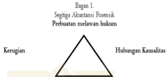
Gambar 1. 1 Teori Segitiga Akuntansi Forensik

Dalam segitiga akuntansi forensik aspek hukum yang paling utama adalah memastikan ada atau tidaknya kerugian, serta apabila kerugian tersebut ada, bagaimana metode perhitungannya. Dalam kerangka hukum segitiga ini, kerugian menjadi unsur pertama. Unsur kedua adalah perbuatan melawan hukum. Tanpa adanya perbuatan melawan hukum, tidak terdapat dasar untuk menuntut penggantian kerugian. Unsur ketiga adalah hubungan antara kerugian dan perbuatan melawan hukum tersebut, yakni hubungan kausalitas.