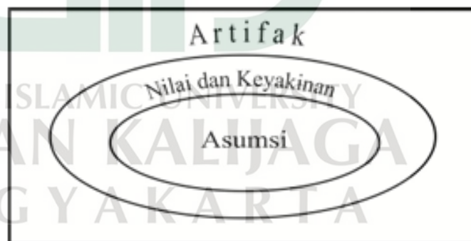
Gambar 1 Level Budaya Menurut Schein

Asumsi dasar merupakan tingkat budaya yang paling dalam dan bersifat tidak terlihat. Asumsi ini berupa keyakinan yang telah mengakar dan diterima sebagai kebenaran oleh seluruh anggota organisasi, sehingga jarang dipertanyakan. Dalam konteks sekolah, asumsi dasar dapat berupa keyakinan bahwa pendidikan tidak hanya bertujuan mentransfer ilmu pengetahuan, tetapi juga membentuk karakter dan akhlak peserta didik. Selain itu, terdapat pula keyakinan bahwa pembentukan karakter harus dilakukan secara berkelanjutan melalui pembiasaan, keteladanan, dan lingkungan yang mendukung. Asumsi dasar inilah yang menjadi landasan utama dalam terbentuknya budaya sekolah secara keseluruhan.