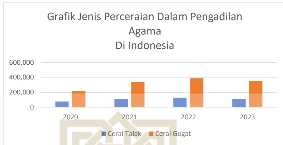
Gambar 1. Grafik Jenis Perceraian Dalam Pengadilan Agama Di Indonesia

Dari grafik yang telah disajikan nampak bahwa kasus cerai gugat menjadi perkara yang dominan terjadi dalam pengadilan agama di Indonesia. Meskipun mendominasi, namun bukan berarti secara keseluruhan cerai gugat diputus dengan amar talak bain sebab pengadilan juga memasukkan khuluk dengan amar talak satu khul'i dalam kategori perkara cerai gugat. 10