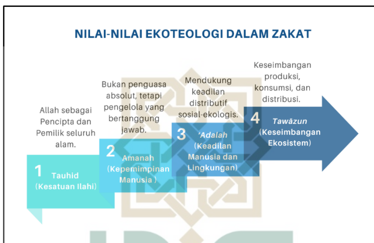
Gambar 2.1. Identifikasi Nilai-Nilai Ekoteologi

Untuk melihat lebih lanjut nilai-nilai ekoteologi yang akan diidentifikasi dalam penafsiran ayat-ayat zakat yang telah ditetapkan sebelumnya, dapat dilihat pada Gambar 2.1. di bawah ini.