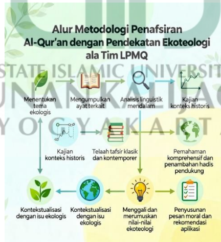
Gambar 1.1. Teknik Penafsiran Perspektif Ekoteologi

Adapun alur metodologi penafsiran ayat-ayat zakat perspektif ekoteologi pada kajian ini, dapat dilihat lebih lanjut pada Gambar 1.1. sebagai berikut.