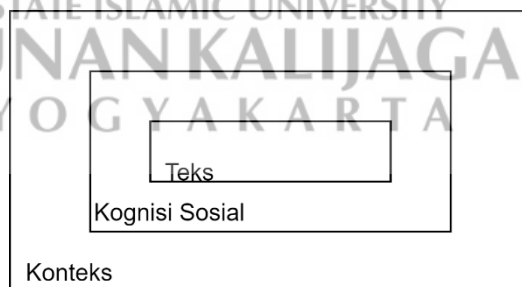
Gambar 1. Model analisis wacana kritis van Dijk

Posisi kerangka teori sangat penting dalam sebuah penelitian ilmiah guna mempertegas alur sebuah analisis dan menjawab rumusan masalah. Sebagaimana dijelaskan pada uraian sebelumnya penelitian ini menggunakan analisis wacana kritis (AWK) model Teun A. van Dijk. Secara garis besar van Dijk melihat wacana dari tiga dimensi yakni teks, kognisi sosial, dan konteks sosial, ketiga dimensi wacana tersebut dijadikan menjadi satu kesatuan untuk dianalisis. 44 Berikut gambaran model analisis van Dijk: