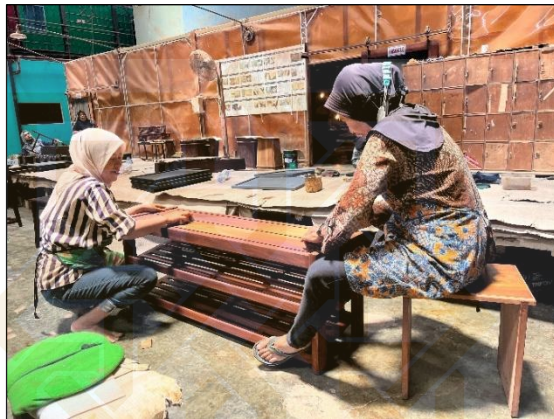
Gambar 1.2. Proses Pengamplasan Finishing

karakteristik, standar mutu, dimensi, bentuk, warna finishing yang berbeda beda di setiap produk dan berbeda beda dari tiap buyer . Oleh karena itu para pekerja memiliki tuntutan performansi yang tinggi dalam bekerja, menyebabkan tingkat stress pada pekerja menjadi tinggi.