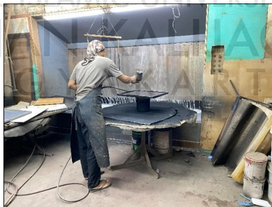
Gambar 1.3. Proses Pengecatan Menggunakan Cat Semprot

Gambar 1.2 merupakan hasil observasi awal, pekerja pada proses pengamplasan kerap berada dalam posisi jongkok dan membungkuk dalam durasi panjang tanpa alat bantu ergonomis yang memadai. Kondisi postur kerja yang tidak ergonomis ini turut berkontribusi terhadap peningkatan beban kerja secara keseluruhan, khususnya pada aspek Physical Demand dalam pengukuran NASA-TLX.