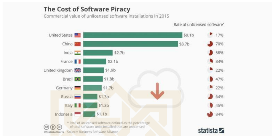
Gambar 1 Data Nilai Komersial Praktik Software Piracy di Dunia 16