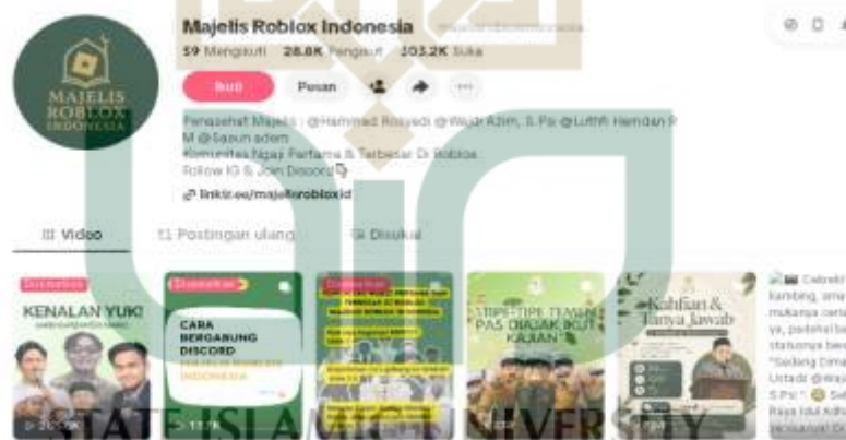
Gambar 1.1 Profil Akun TikTok @majelisrobloxindonesia

Diantara komunitas dakwah virtual yang terus bermunculan, komunitas ini menjadi komunitas yang paling aktif di platform game Roblox dan TikTok, yang kini memiliki 28,8 ribu pengikut, 12 dengan ribuan hingga puluhan ribu views pada konten mereka.