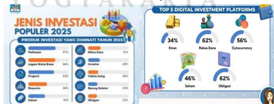
Gambar 1. 1 Jenis Investasi Populer 2025

Terdapat beberapa instrumen investasi digital yang sering dijumpai di antaranya adalah saham, reksa dana, emas dan obligasi. Investasi yang cukup menarik pada masa kini salah satunya adalah investasi emas digital (Silviani et al. , 2024). Seiring berjalannya waktu maka semakin banyaknya instrumen investasi dan ragamnya minat masyarakat untuk menjadi investor pada beberapa jenis instrumen investasi yang sedang tren pada tahun 2025 yang dapat dilihat dari gambar hasil survei yang dilakukan Astra Credit Companies (ACC) berikut.