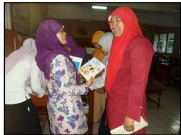
Gb. Kegiatan perpustakaan keliling