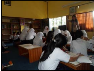
Gb. Penggunaan kelas alternatif