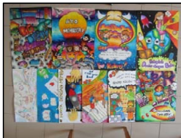
Gb. Hasil lomba poster tentang perpustakaan