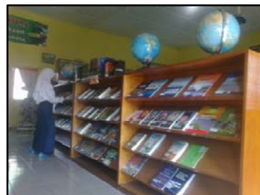
Gb. Rak display