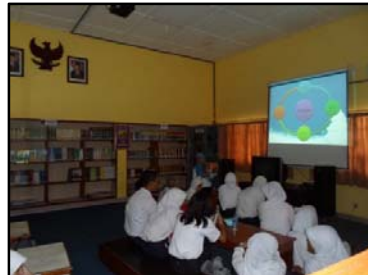
Gb. Pendidikan pemakai lanjutan ( library skill )