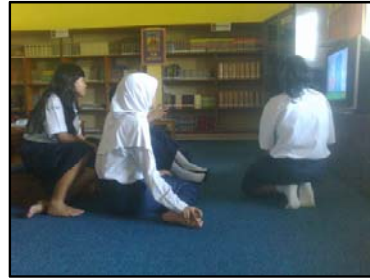
Gb. Pemanfaatan audio visual oleh siswa