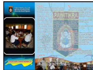
Gb. Leaflet perpustakaan