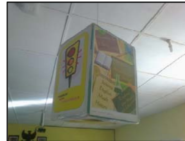
Gb. Dekorasi/ hiasan perpustakaan