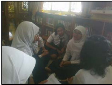
Gb. Siswa sedang menceritakan novel The Host kepada teman-temannya ( story telling )