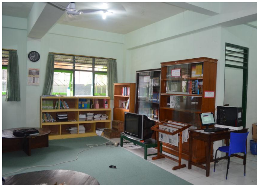
Foto Ruang Perpustakaan Sesudah PPL