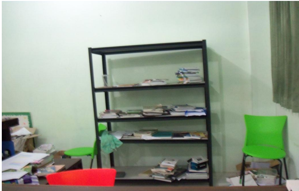
Foto Area Sirkulasi Sesudah PPL