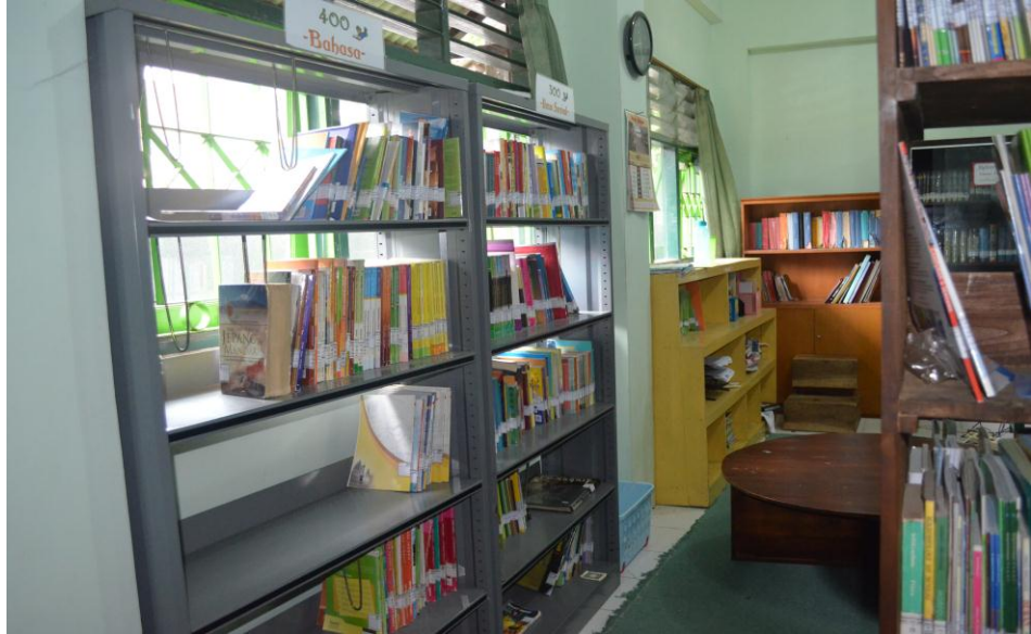
Foto Rak Koleksi Sesudah PPL