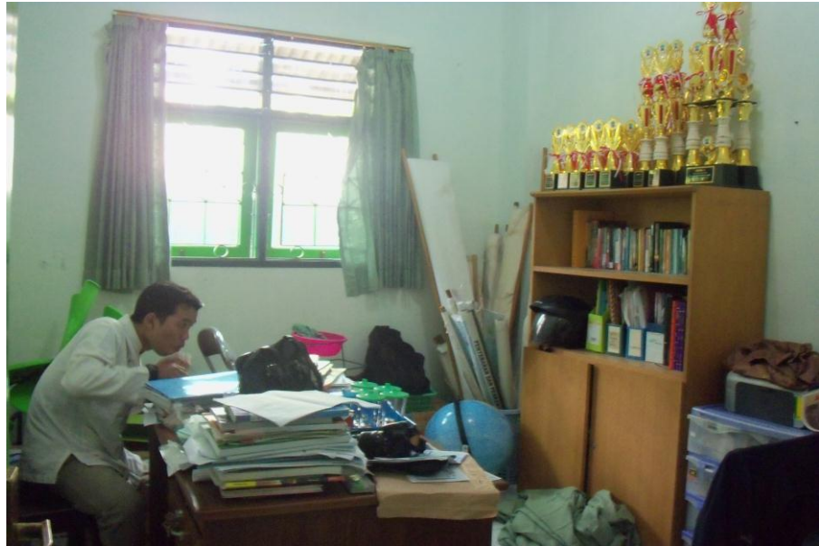
Foto Ruang Kepala Perpustakaan Sesudah PPL