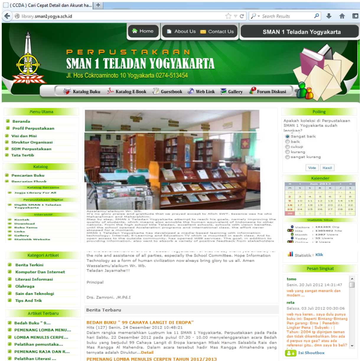
Gb. Tampilan website perpustakaan SMA N 1 Yogyakarta