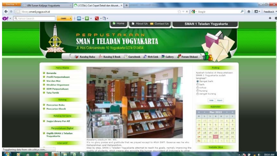
Gb.2 tampilan website SMA N 1 Yogyakarta