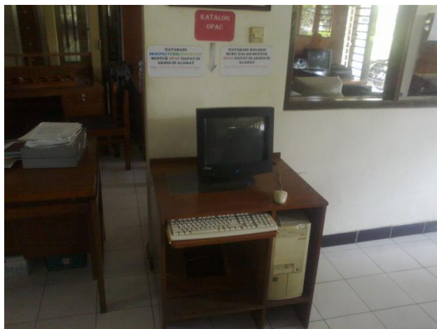
OPAC Sistem Openbiblio