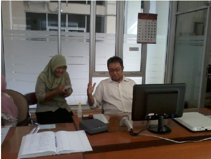
Lampiran 4. Foto Wawancara dengan petugas perpustakaan